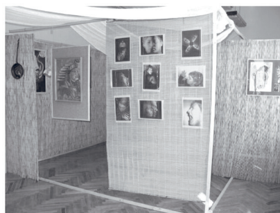
Művészetek Völgye, 2003, Monostorapáti, iskola. Labirintus-installáció a szörny-projekt alkotásaival